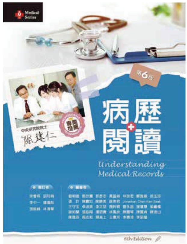
圖一 病歷閱讀（第六版）

病歷是病人重要的診療記錄，病歷為醫療診療過程及結果的紀錄，病歷記錄完整及完成時效，對病人的優質醫療照護與醫院健康保險申報、醫療爭議及教學研究是重要資料。病歷書寫，涉及到文法、專業、品質、以及法律等層面，是醫院評鑑最不容易達標的項目，但不論如何病歷書寫，最主要的功能，在於「清楚地記錄與傳達正確詳實的病人訊息」以及「醫師評估與診治的意見」。（註：參考王志嘉，「病歷寫作技巧與相關法律責任」，月旦實務講座，2014年7月9日）