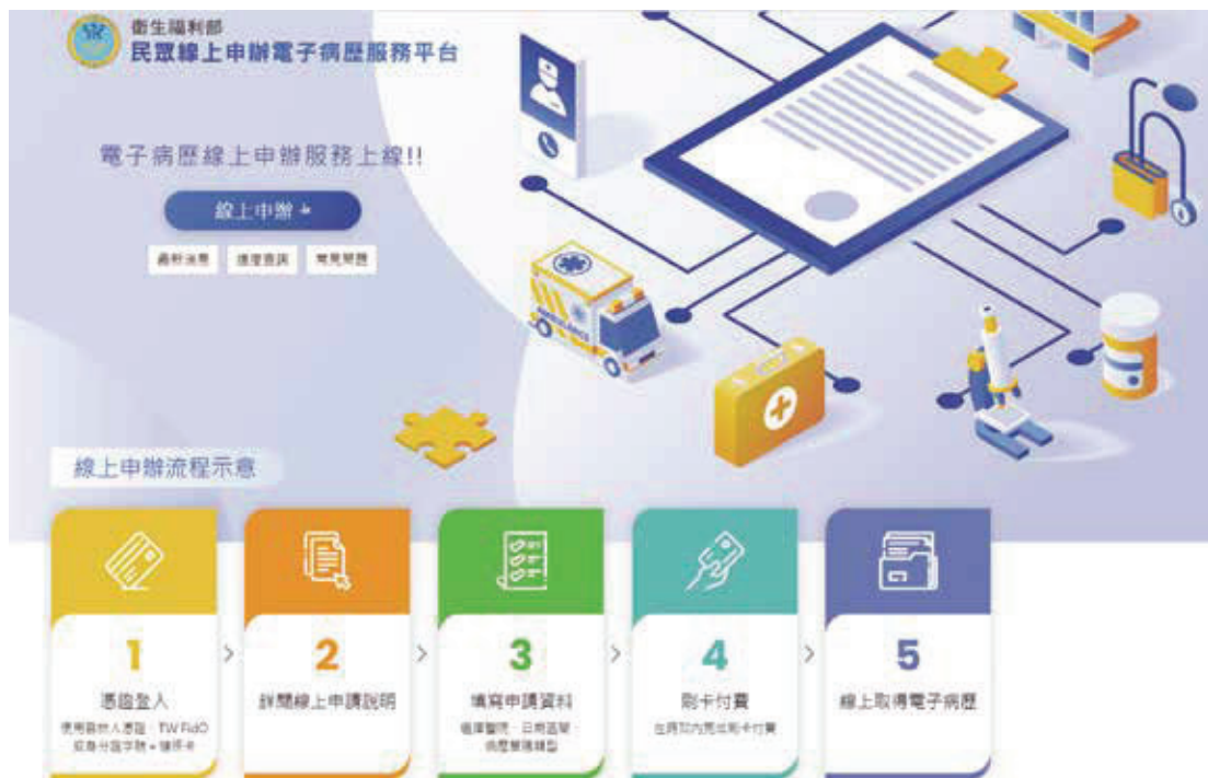
圖四 線上申辦電子病歷服務平台

《個人資料保護法》第6條第一項：「有關病歷、醫療、基因、性生活、健康檢查及犯罪前科之個人資料，不得蒐集、處理或利用。但有下列情形之一者，不在此限：…」亦即「病歷」（筆者註：病歷為立法院104年12月